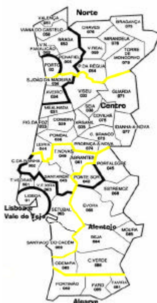
Figura 1 – Mapa de Portugal Continental com as demarcações das zonas de rede da PT e das Regiões de Saúde (amarelo).

Para que a distribuição da amostra de assinantes/ua, em cada região, fosse representativa da sua população, optou-se por seleccionar, de cada grupo de rede, um número de assinantes/ua proporcional à sua representação, no conjunto de assinantes que representam a região. Para definir o peso que cada grupo de rede tem em cada região, fez-se uso da percentagem que o número de páginas desse grupo de rede/lista telefónica representa no total das páginas afectadas a essa região. A título de exemplo descreve-se os procedimentos efectuado para região Centro (Tabela 2).